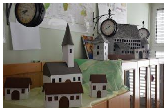
Učenci pri urah OPK izdelali maketo srednjeveškega Majšperka.